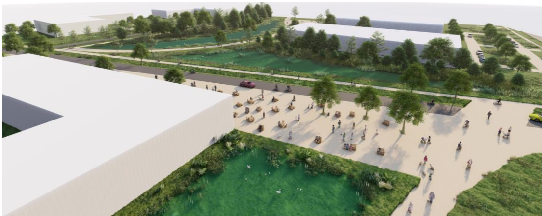
Figure 5 : Vue de l'espace restauration/détente

Afin de compléter cette offre un large espace est dédié aux services à offrir au Sud du parc. Il pourrait accueillir un ou des établissements de restauration, de détente type spa, ou d'activité sportive type paddle. Non seulement à disposition des entreprises locales, il permet de faire rentrer la ville dans le parc.