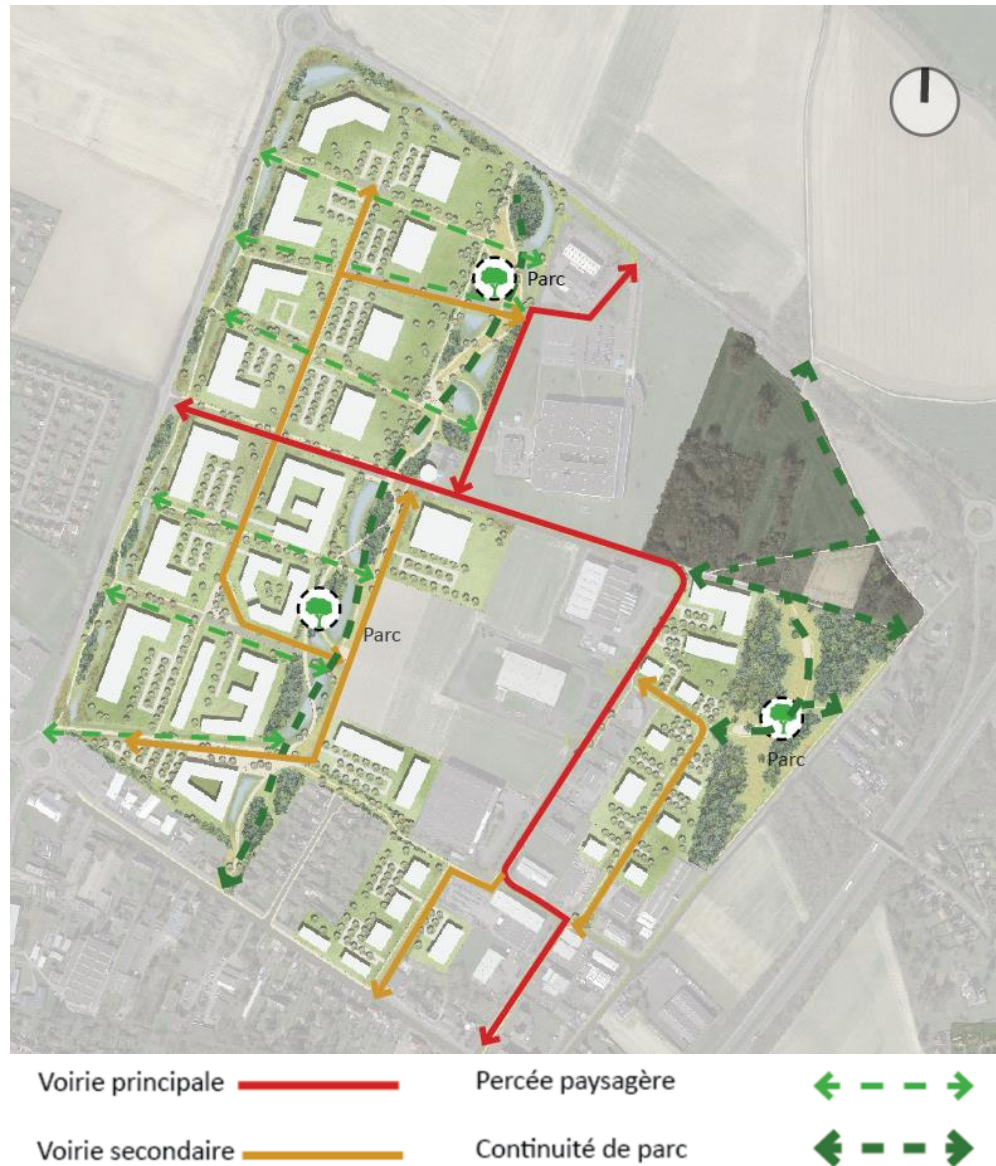
Figure 2 : Trame viaire