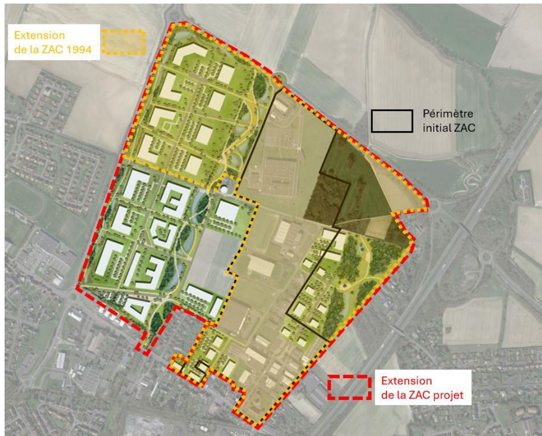
Figure 1 : Plan de situation

Implanté aux portes Est de la métropole de Valenciennes, la zone de Dix Muids est implantée entre la sortie de l'autoroute A2 et le tissu résidentiel de la ville de Marly.